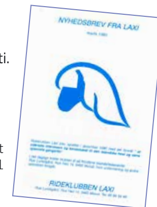
1. nr af Laxi bladet marts 1991